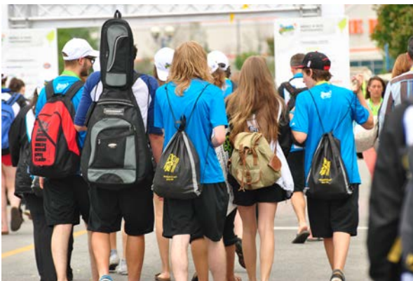
Des participants en route pour la cérémonie de clôture des jeux

Pendant cinq jours du 23 au 27 juillet, ces jeux ont permis aux élèves de notre réseau des écoles de langue française de vivre une expérience riche en émotion et de construire des liens avec d'autres jeunes de la francophonie canadienne.