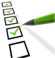
Table nationale sur l'éducation :

Appui des membres aux conseils scolaires en Cour suprême du Canada