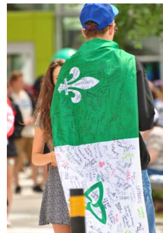
Un participant arbore fièrement le drapeau franco-ontarien

Les Jeux se tiennent en été tous les trois ans. La prochaine édition aura lieu en 2017 au Nouveau-Brunswick, à Dieppe et Moncton. ←