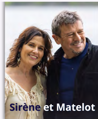
Sirène et Matelot