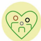
Pilier 1 : Bien-être, équité et inclusion