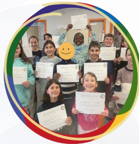
Brigade acti-leaders dans les écoles élémentaires catholiques Laurier-Carrière et Sainte-Bernadette