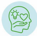
Pilier 2 : Pédagogie transformée et innovante