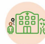
Pilier 4 : Organisation agile, écoresponsable et dynamique